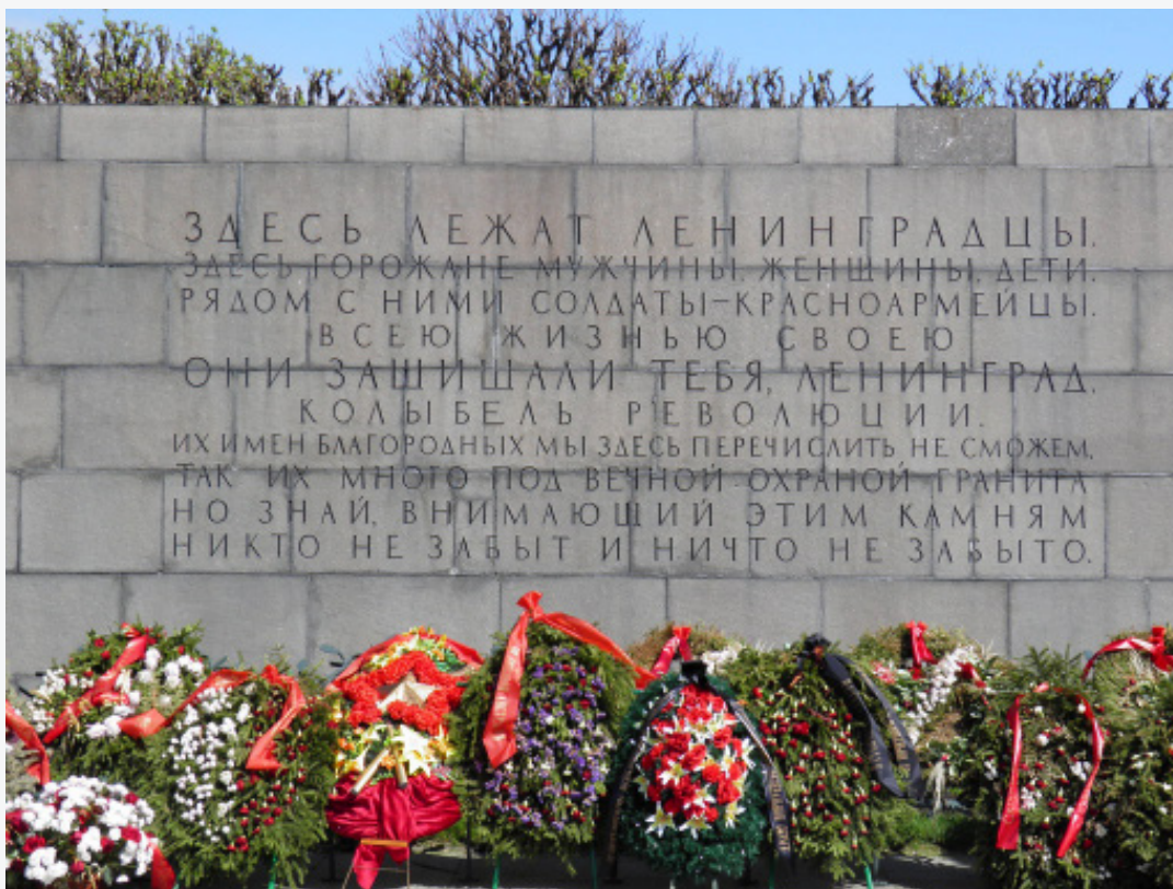
Пискарёвское мемориальное кладбище, г. Санкт-Петербург